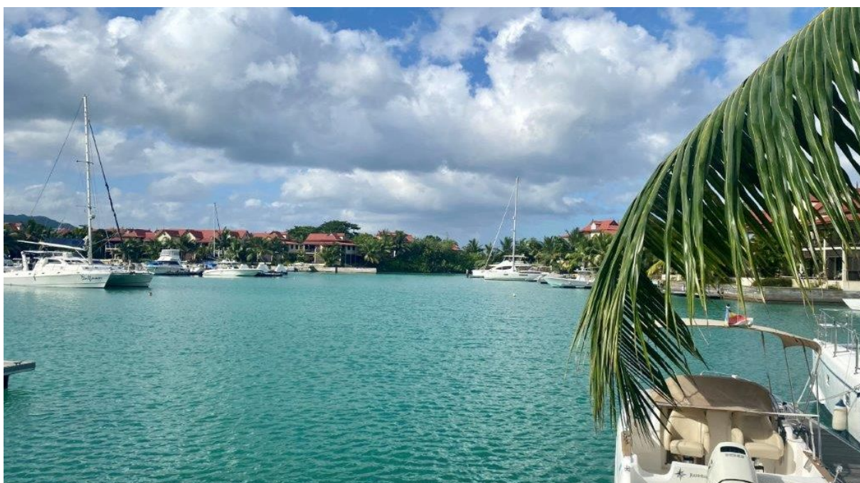
Poloha apartmánu a kotviště pro loď

(5% Stamp duty, 1,5% Sanction Application Processing Fee, 1,5 % Notary Fee)