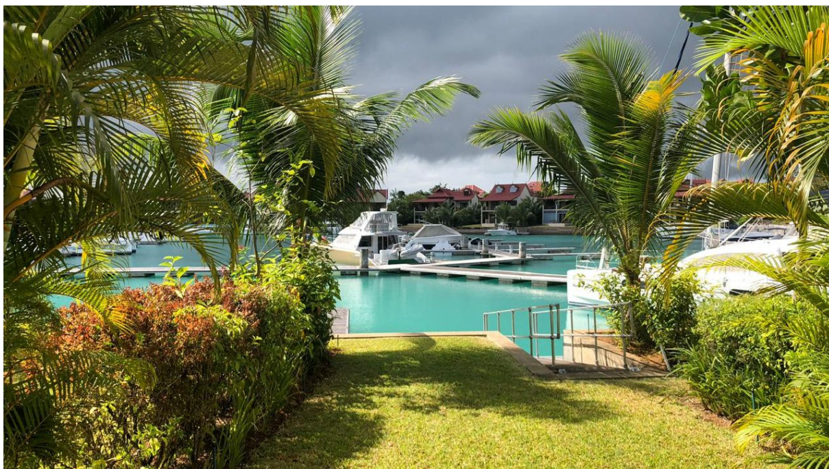
Poloha apartmánu a kotviště pro loď

(5% Stamp duty, 1,5% Sanction Application Processing Fee, 1,5 % Notary Fee)