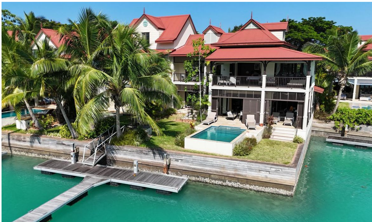
Poloha maisonu v resortu Eden Island