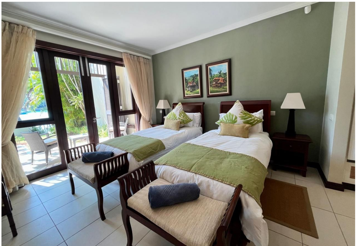
Výhled z terasy