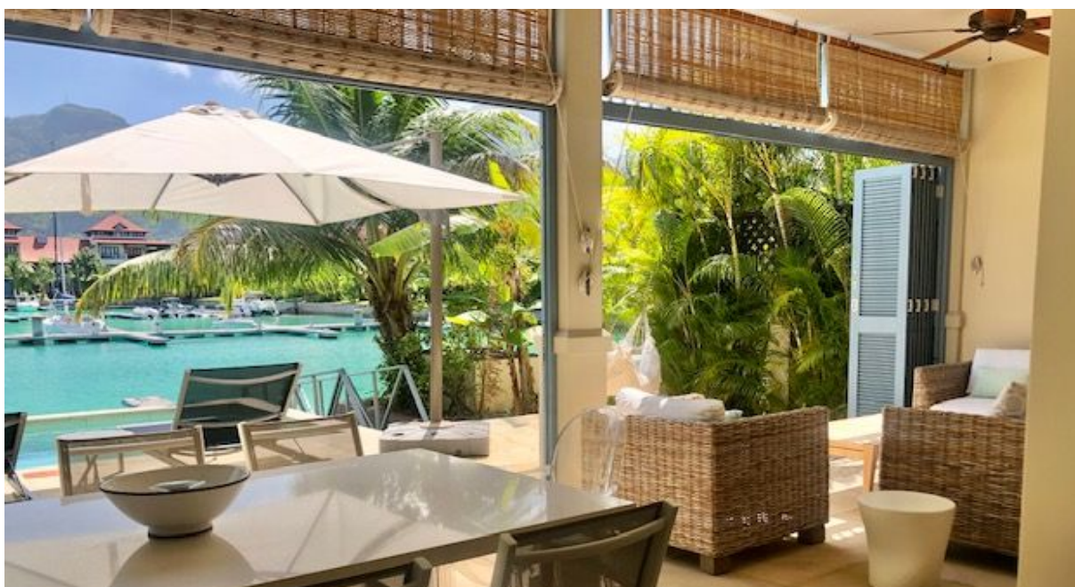
Poloha maisonu v resortu Eden Island

Cena: 1 700 000 USD (včetně nábytku) + daně z převodu (5% Stamp duty, 1,5% Sanction Application Processing Fee, cca 1,5% Notary Fee)