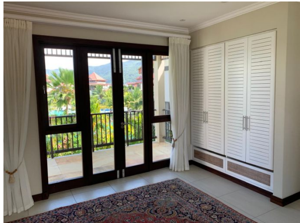
Výhled na Eden Island a hlavní ostrov Mahé