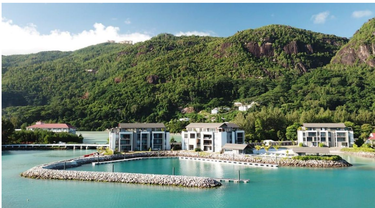
Poloha apartmánu v resortu Pangia Beach

Cena: 980 000 USD + 10 % daně z převodu, osobní vlastnictví (V ceně je zahrnuto i veškeré vybavení apartmánu.)